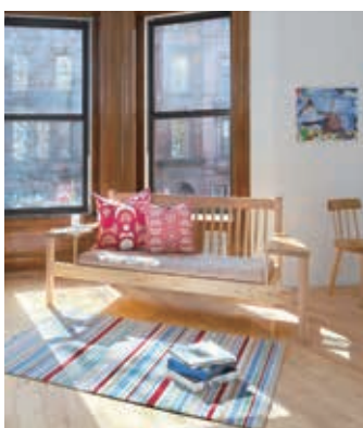
国産杉を利用した家具「HIDA」

学舎を卒業した後、2年間は飛驒産業に勤め、家具の製作や後進の指導にあたる。その後の進路は、本