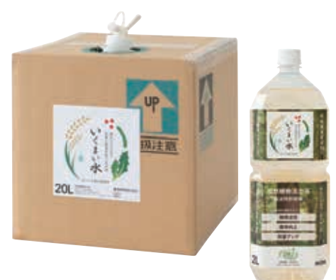
杉枝葉から抽出した天然植物活力液「いくまい水」